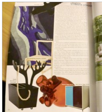
Teppið Stökk í tímaririnu Elle (blátt myndstur á gráum grunni) eftir Sigrúnu Láru Shanko.

Hönnunarmars árið 2012 var tilvalinn vettvangur til að sýna hvað þær stóllur höfðu verið að bralla og þær sýndu þær fyrstu teppin.